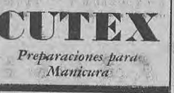
CUTEX Preparaciones para Manicura

Por su sencillez, el Método Cutex para manicura, es admirable para las damas muy ocupadas. Siguiendo su sencillo procedimiento, sus manos serán más hermosas. La base de una manicura perfecta es el Quita-cutícula Cutex. Úselo para moldear la cutícula y limpiar las uñas, bajo las puntas. Use luego el Quita-esmalte Oleoso Cutex para quitar el esmalte anterior. Ablanda la cutícula y corrige las uñas resquebrajadas. Después, aplíquese el Esmalte Cutex que es el preferido por los ámbitos de la elegancia femenina mundial. Proporciona un lustre superior y más durable. Además, es fácil de aplicar. Use el lápiz blanco para uñas bajo las puntas y extiéndalo un poco de crema o aceite sobre la cutícula. Siga con regularidad este procedimiento de manicurarse y verá que pronto sus uñas se verán más bonitas que nunca.